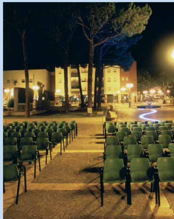
Piazza Gramsci, Alfonsine