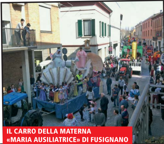
IL CARRO DELLA MATERNA «MARIA AUSILIATRICE» DI FUSIGNANO