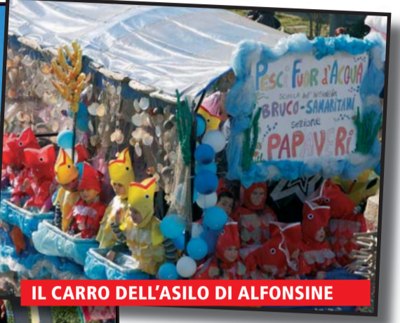
IL CARRO DELL'ASILO DI ALFONSINE