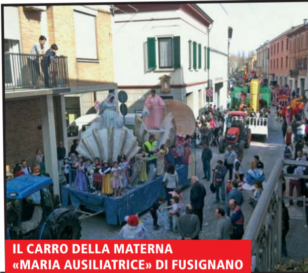
IL CARRO DELLA MATERNA «MARIA AUSILIATRICE» DI FUSIGNANO