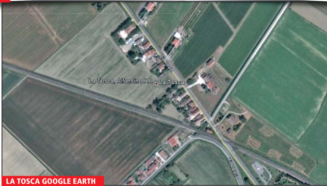
LA TOSCA GOOGLE EARTH