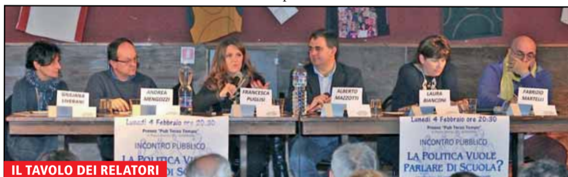
IL TAVOLO DEI RELATORI

Nonostante sporadici interventi che sapevano tanto da comizio in vista delle prossime elezioni, il dibattito è stato costruttivo sotto tutti i punti di vista. Gli insegnanti e i genitori presenti alla serata hanno colto giustamente l'occasione per sfogarsi e far conoscere le precarie condizioni in cui ci troviamo. È stato toccante ascoltare l'indignazione degli insegnanti, la loro umiliazione e fatica nel cercare di mettere tutto l'impegno nel fare un lavoro che amano ma scontrarsi con mille difficoltà. La scuola è la cartina di tornasole di tanti, troppi, problemi sociali e gli insegnanti non possono essere lasciati soli nell'affrontarli, per di più spogliati delle risorse necessarie per farlo.