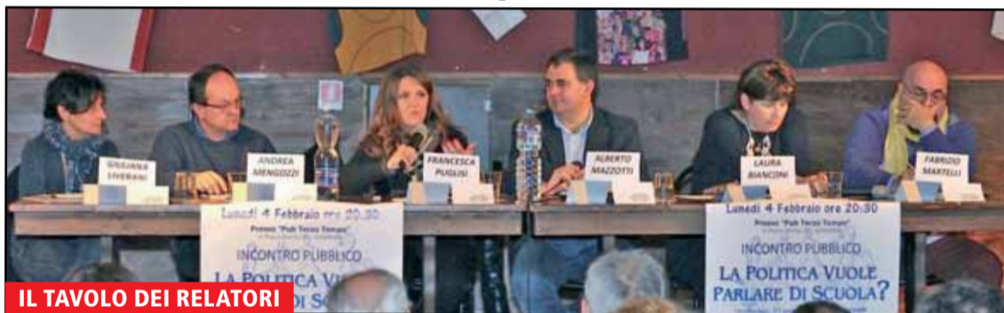
IL TAVOLO DEI RELATORI

Nonostante sporadici interventi che sapevano tanto da comizio in vista delle prossime elezioni, il dibattito è stato costruttivo sotto tutti i punti di vista. Gli insegnanti e i genitori presenti alla serata hanno colto giustamente l'occasione per sfogarsi e far conoscere le precarie condizioni in cui ci troviamo. È stato toccante ascoltare l'indignazione degli insegnanti, la loro umiliazione e fatica nel cercare di mettere tutto l'impegno nel fare un lavoro che amano ma scontrarsi con mille difficoltà. La scuola è la cartina di tornasole di tanti, troppi, problemi sociali e gli insegnanti non possono essere lasciati soli nell'affrontarli, per di più spogliati delle risorse necessarie per farlo.