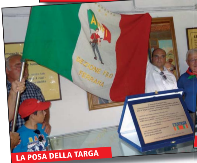
LA POSA DELLA TARGA