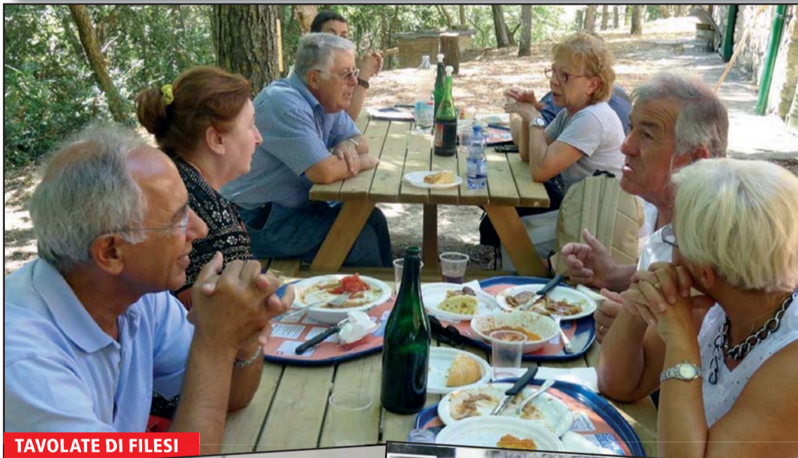
TAVOLATE DI FILESI