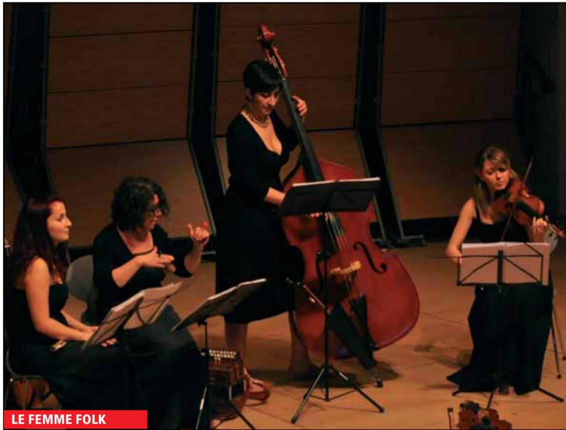
LE FEMME FOLK